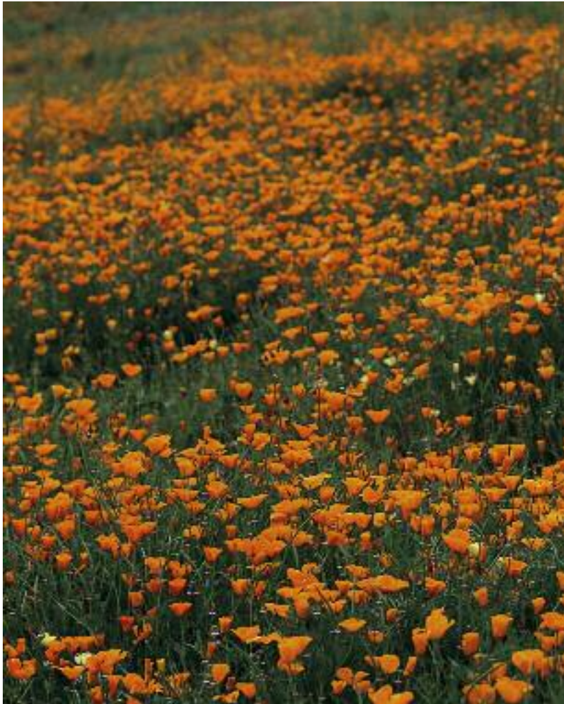
カリフォルニアゴールドポピー